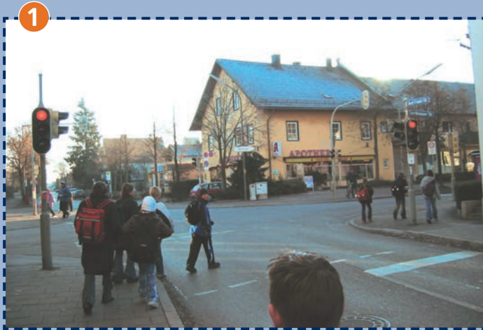
1 Kreuzung Josef-Frankl-Straße/Lerchenauer Straße. Hier stehen unsere Schulweghelfer.