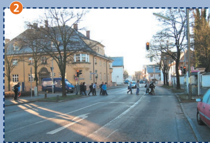
2 Übergang Feldmochinger Straße/Kirche St. Peter und Paul