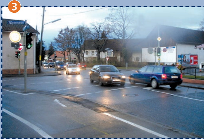
3 Kreuzung Pflaumstraße/Feldmochinger Straße