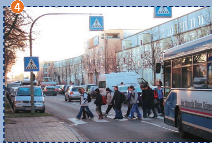
4 Zebrastreifen Josef-Frankl-Straße/Schaarschmidtstraße